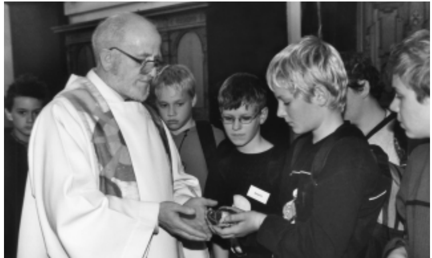
Der Stein mit einer Reliquie von Bruder Klaus sagt den jungen Menschen: Beim Besuch in Sachseln/Flüeli-Ranft hast du einen Wegbegleiter gefunden.