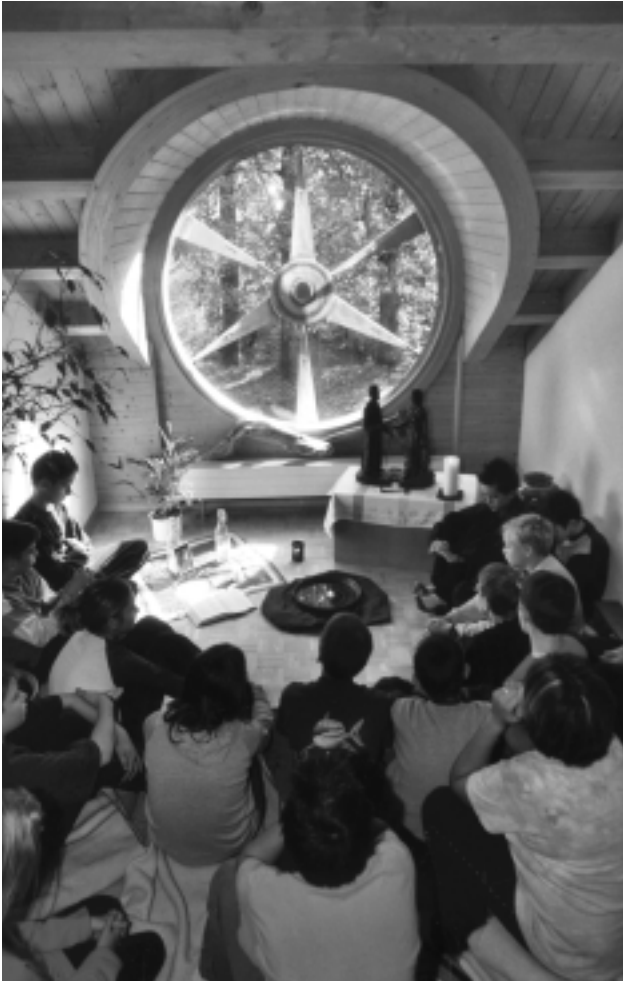
Die Besucher der Jugendunterkunft schätzen deren grosszügige Einrichtung. Ein Kleinod ist der kleine Meditationsraum.