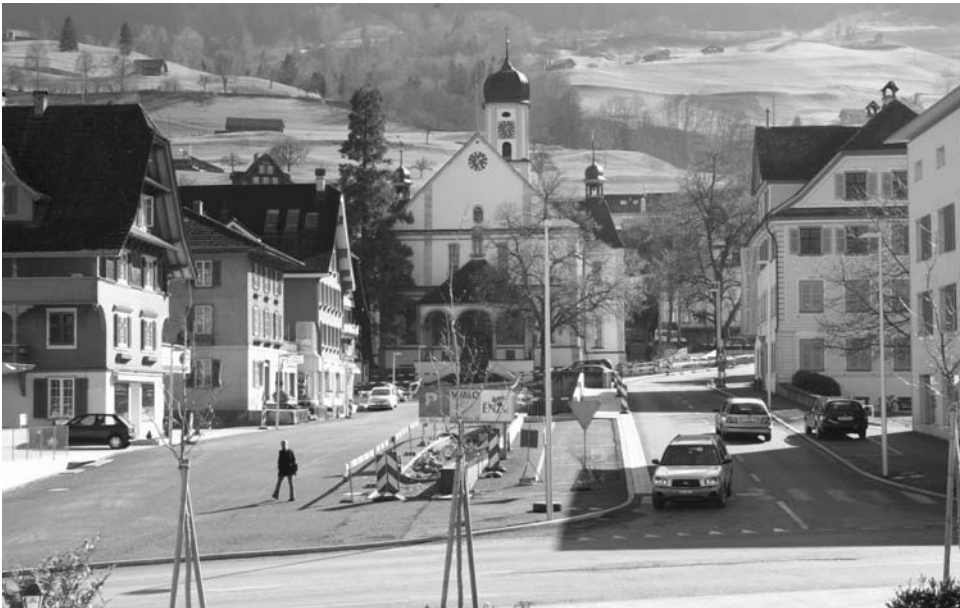
Drei Elemente prägen den neuen Sachseler Dorfkern. Links der neue Dorfplatz, in der Mitte der Dorfbrunnen und rechts die Dorfstrasse.

Am 15. August 1997 ist das Dorf Sachseln von einem schweren Unwetter heimgesucht worden. Zum Schutz der Wohngebiete vor künftigen Überflutungen wurden umfangreiche Sicherheitsmassnahmen realisiert und der Dorfbach wurde in ein südlich des Dorfkerns erstelltes neues Bachgerinne umgeleitet. Diese Massnahmen haben sich bei den sehr starken Regenfällen im August 2005 bestens bewährt.