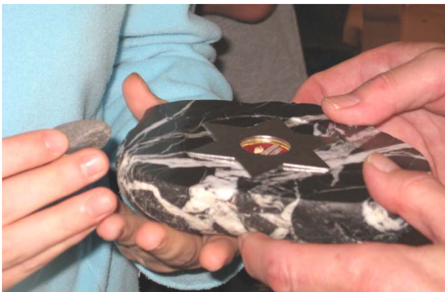
Bilder: Berufsfachschule Nidwalden / Schulisches Brückenangebot / Do 3. Juli 2008: Exkursion zu Bruder Klaus in den Ranft / Thema: „Auf der Suche nach der Lebenslinie.“