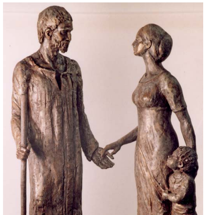
Tonmodell «Bruder Klaus und Dorothea – partnerschaftlicher Dialog» von Maria Törley, Budapest 1990