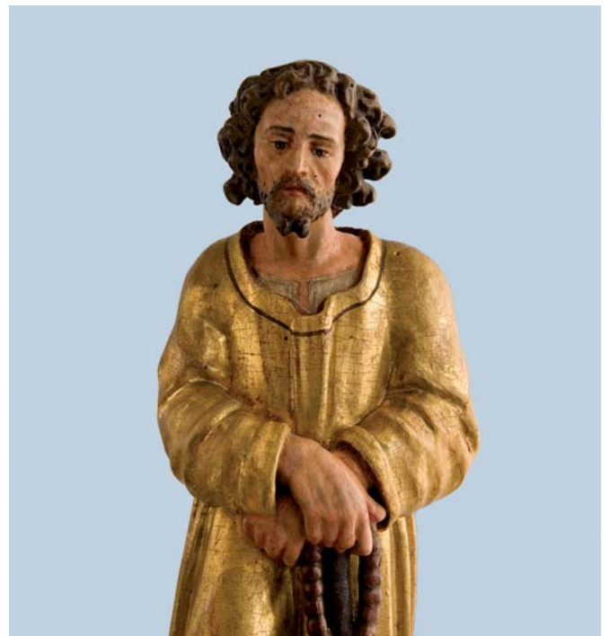
Barocke Statuette im Frauenkloster St. Andreas Sarnen